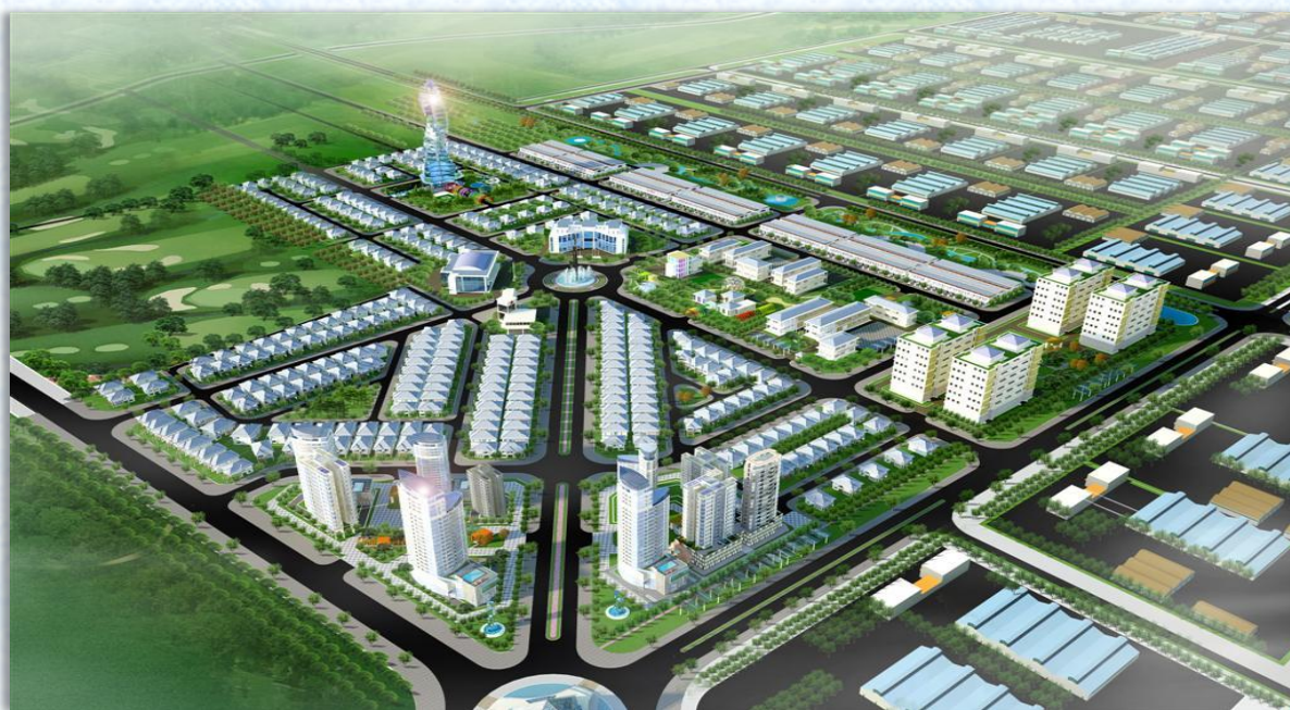
ĐẤT CÔNG NGHIỆP CHO THUÊ